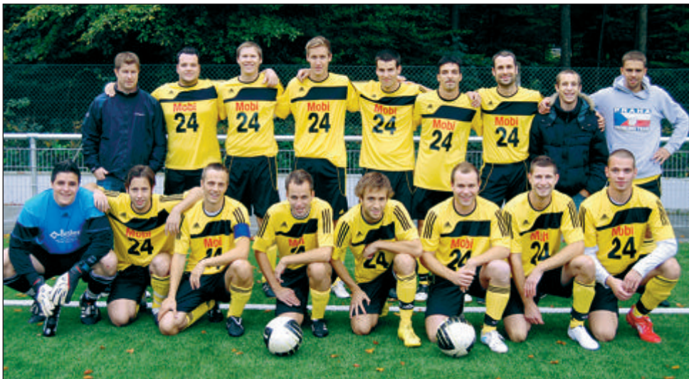
«ds Zwöi» mit den neuen Trikots – Herzlichen Dank an Mobi24!!