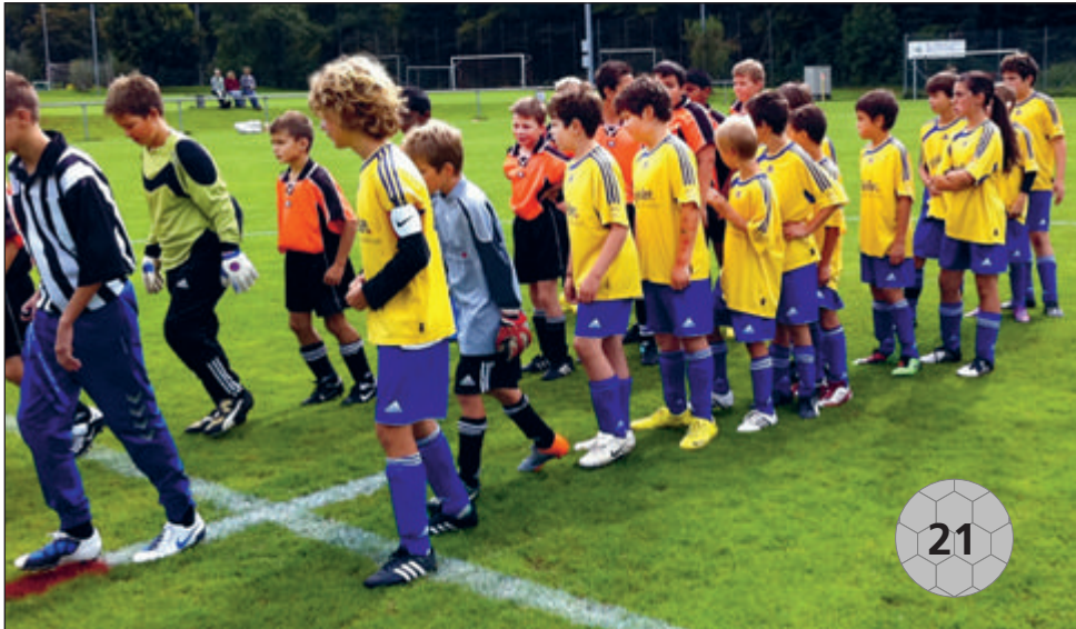
Junioren Dc beim Einlauf zu einem Meisterschaftsspiel.